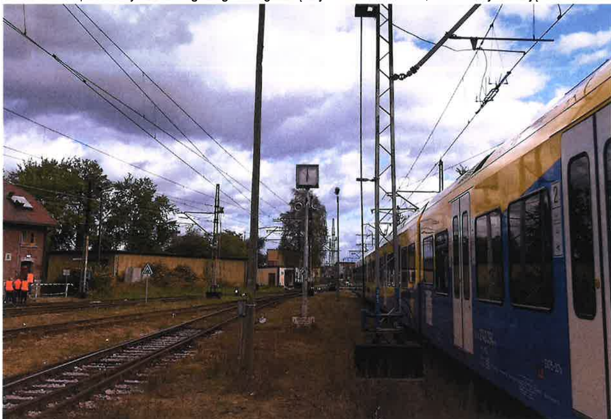
Zdjęcie nr 3 – zegar na międzytorzu 206 i 207