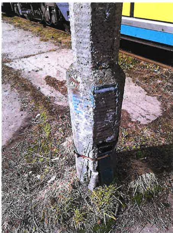
Zdjęcie nr 1- stan techniczny obecnego oświetlenia

Prace projektowe uwzględniać powinny Specyfikację Istotnych Warunków Zamówienia.