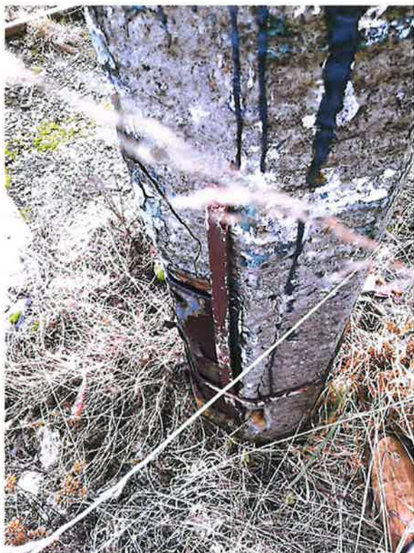
Zdjęcie nr 1- stan techniczny obecnego oświetlenia

W chwili obecnej oświetlenie nieruchomości jest niewystarczające i w znacznym stopniu wyeksploatowane. Część lamp na żelbetonowych słupach oświetleniowych jest nieczynna. Stan słupów oświetleniowych jest zły, a ich długotrwały czas eksploatacji stwarza zagrożenie katastrofą budowlaną. Stan słupów oświetleniowych Zdjęcie nr 1 oraz Zdjęcie nr 2.