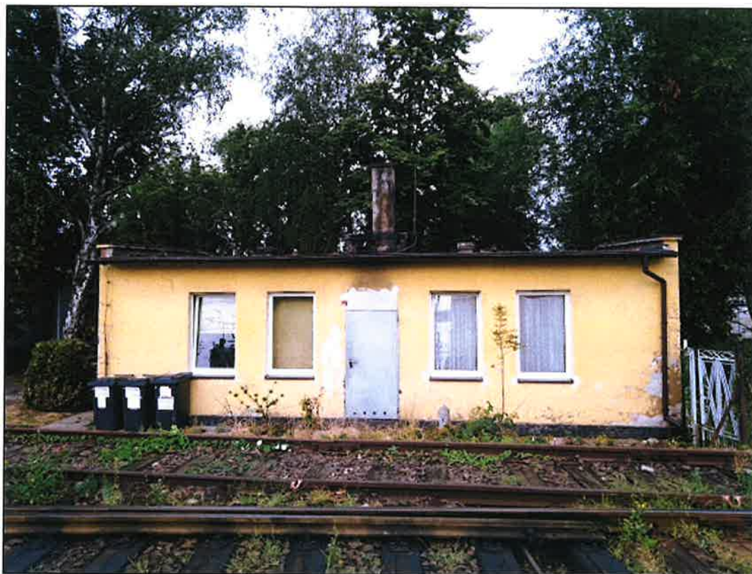
Zdj.2 Elewacja 2 - wschodnia