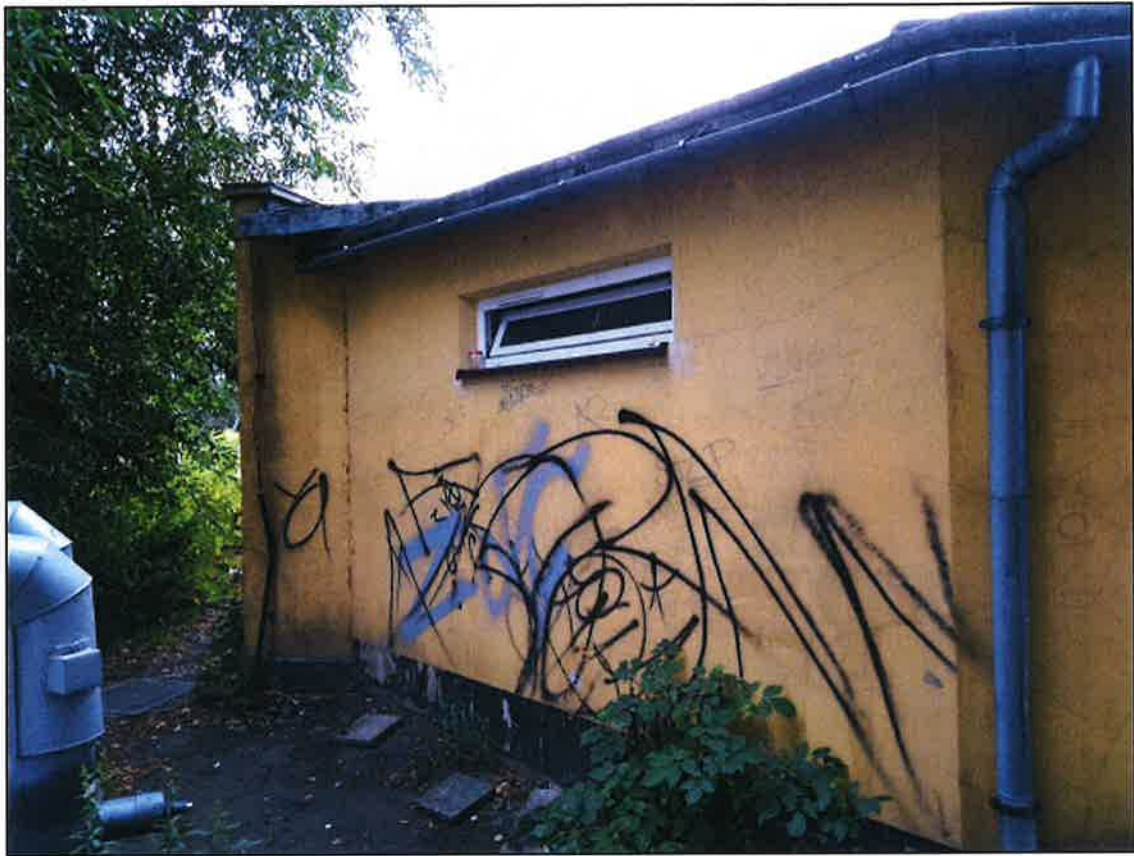
Zdj.4 Elewacja 4 - zachodnia