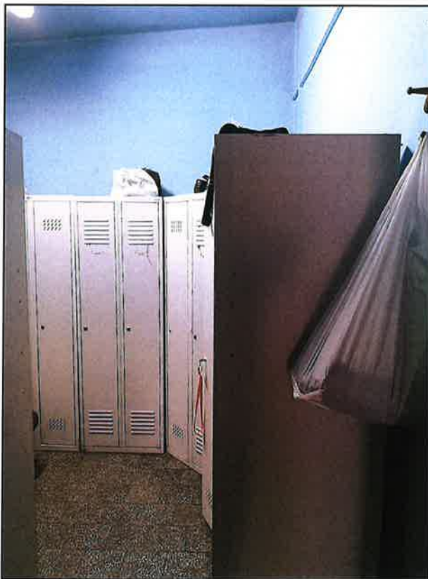
Zdj.9 Szatnia 1