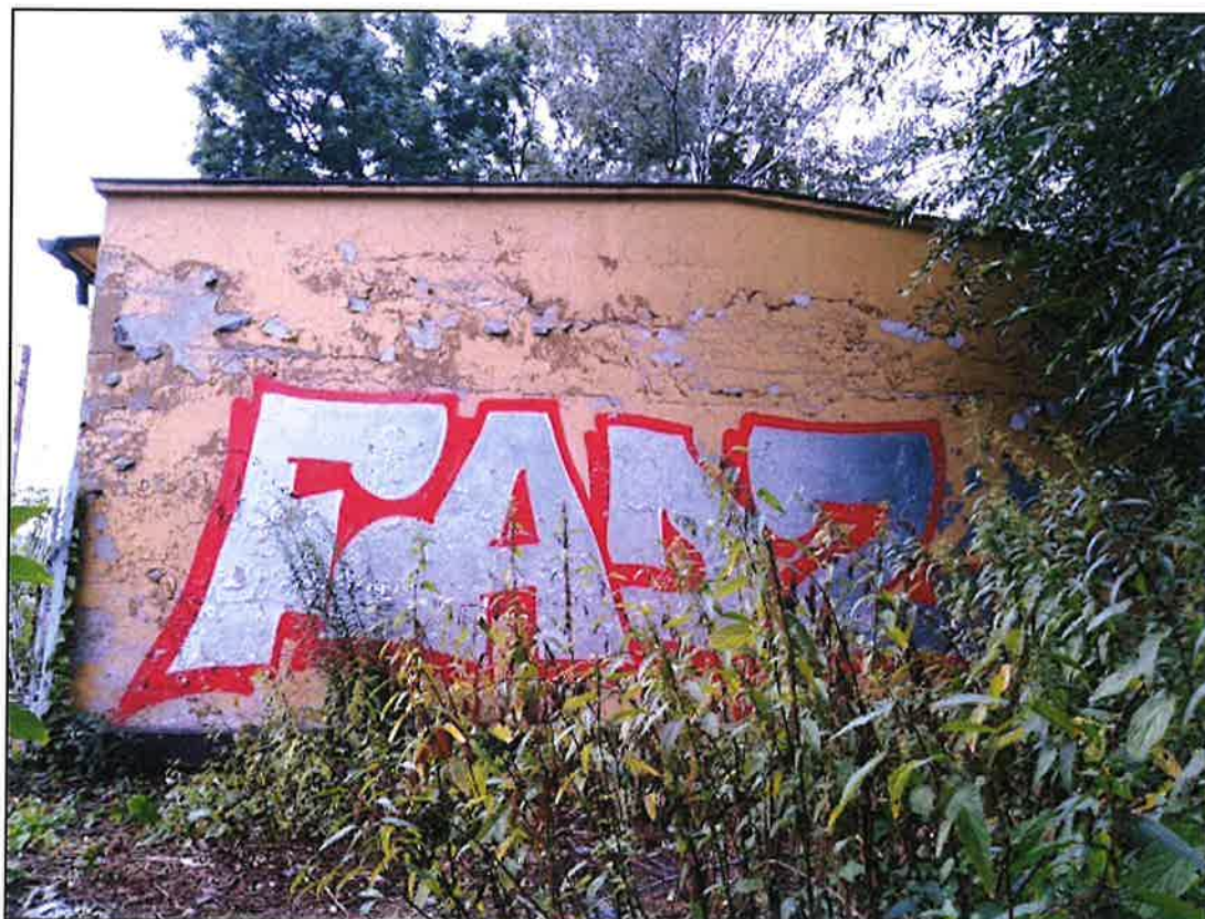
Zdj.3 Elewacja 3 – północna (tylna)