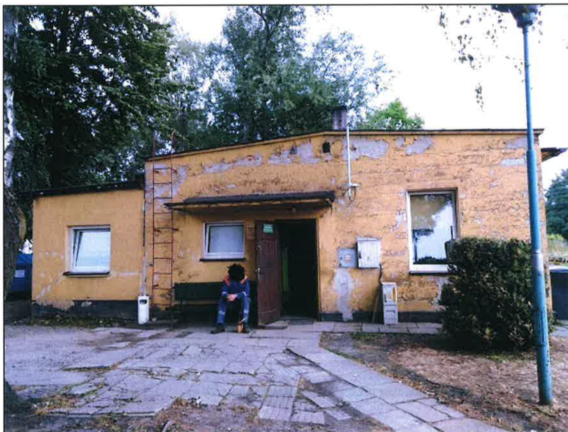
Zdj.1 Elewacja 1 – południowa (frontowa)